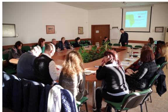
Gabrovo, Bulgaria; 17 Dec 2019

Cea de-a treia masa rotunda a APV cu experții municipali dar și cu părțile interesate a vizat acțiunile și obiectivele din Planul de Acțiune